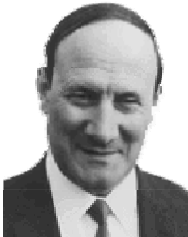
Portrait du père Pire, prix Nobel de la Paix en 1958